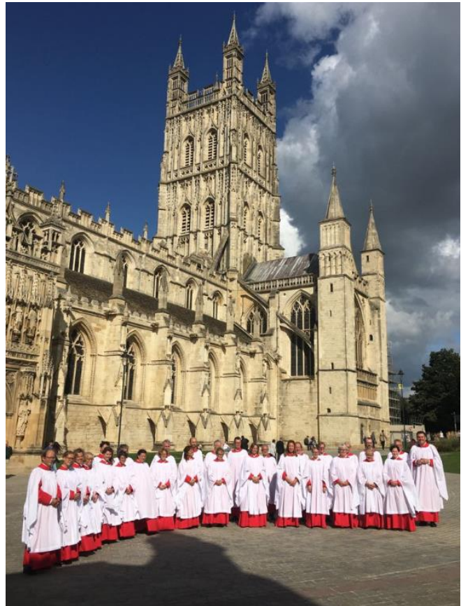
De Leidse Cantorij

datum, zoals het buitengewoon feestelijke “Let all the people praise Thee, O God” van William Mathias , geschreven destijds voor de huwelijksdienst van Charles en Diana. Het Magnificat en Nunc dimittis , de vaste gezongen onderdelen tijdens een evensong, zijn ditmaal van de hand van George Dyson .