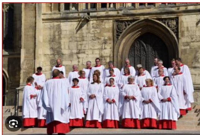
De Leidse Cantorij