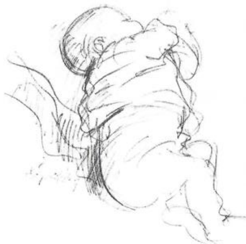
Hans Bouma, Kind van hun dromen / tekening, Otto Dicke