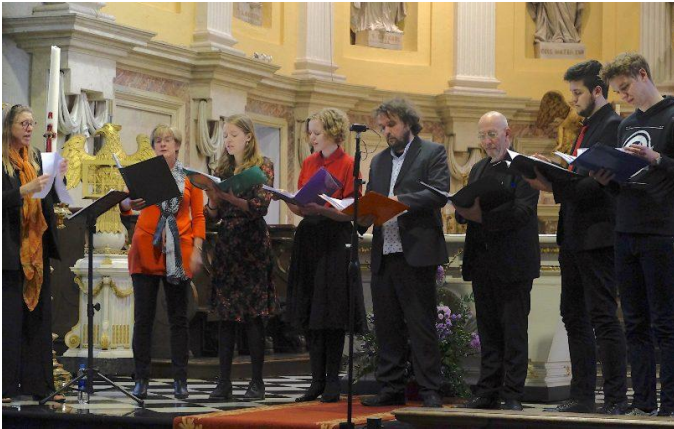
Capella Sine Vinculis