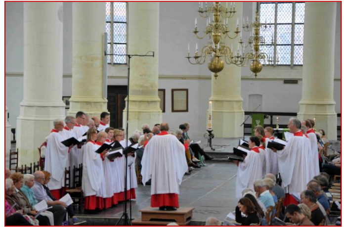
De Leidse Cantorij