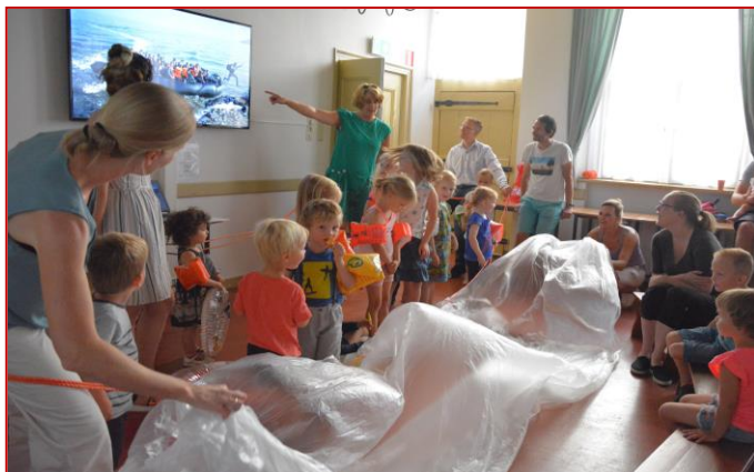
Hard aan het werk, in de kliederkerk