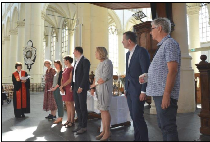
23 juni j.l. bevestiging nieuwe ambtsdragers