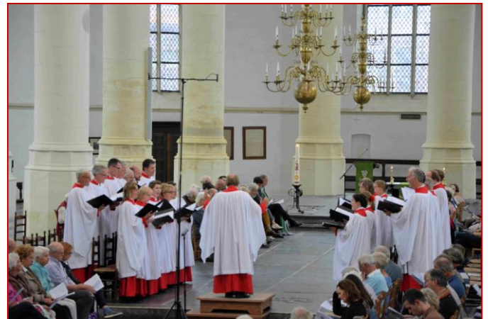
De Leidse Cantorij