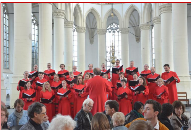
De cantorij in 'rood'

Afgelopen december, tijdens het Adventsconcert vond de primeur plaats: De Leidse Cantorij zong voor het eerst in haar nieuwe toga's.