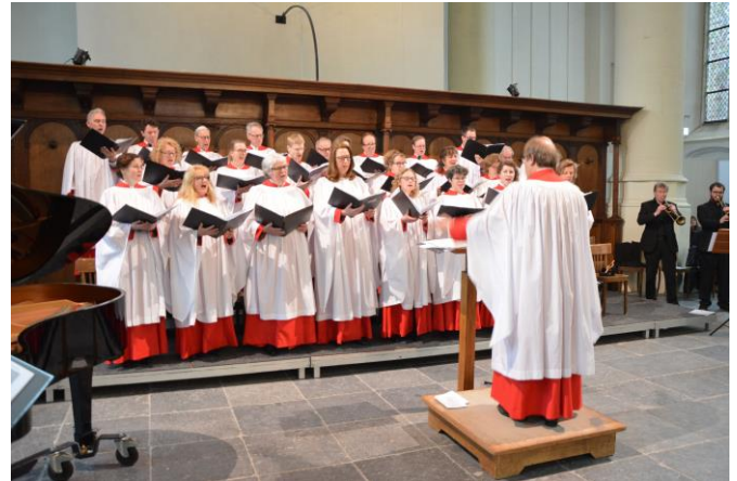
De Leidse Cantorij

aan het eind van de werkdag gehouden om 17.00 uur. In veel kathedralen in de grote steden vindt dit dagelijks plaats, al of niet met 'publiek'. Het is een gebed voor de koren zelf. Dat zie je ook aan de opstelling van de koorleden, dicht bij elkaar. Gasten zijn altijd welkom om te luisteren en mee te bidden.