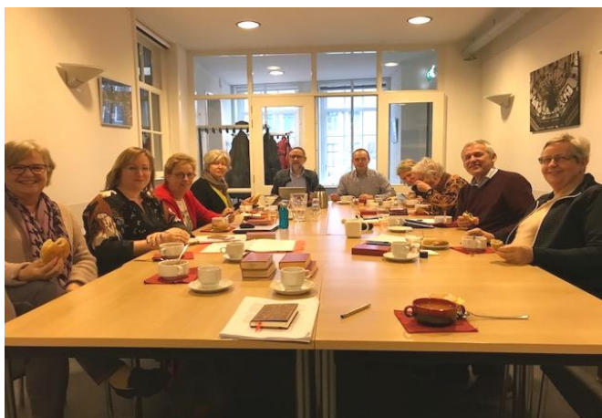
Aan de lunch tijdens de kerkenraadsdag

Er zijn nog voldoende mogelijkheden om ons 'verwelkomen' en 'opzoeken' verder uit te breiden. Meer aansluiting bij de Bakkerij is een punt van aandacht en we kunnen meer gebruik maken van onze prachtige monumentale kerk. Is het in dat verband misschien mogelijk op b.v. woensdagmiddag en een deel van de zaterdag bij de openstelling ook pastoraal en diaconaal present te zijn? Zouden we in aanvulling op onze prachtige stiltehoek een koffiehoek en leestafel kunnen realiseren? Welke aanvullende mogelijkheden zijn er nog met muziek? Kunnen er nieuwe contacten met scholen en studenten worden gelegd? Dit vergt wel nadere doordinking en met name de beschikbaarheid van vrijwilligers. De vraag daarbij is op welke wijze meer gebruik kan worden gemaakt van de talenten van gemeenteleden. We zullen