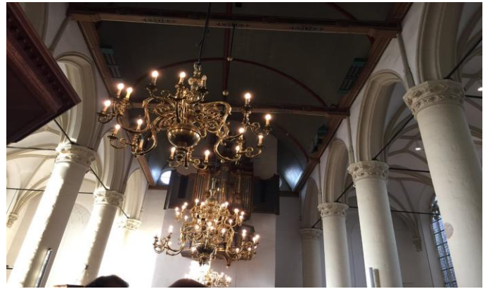
Ook de kroonluchters komen in aanmerking...

gelegen delen in de kerk zijn lastig. Ook omdat daarvoor vaak een stelling nodig is om goed en veilig te kunnen werken. We willen daarom met een grote groep mensen de klussen waar we normaal niet aan toe komen onder handen nemen.