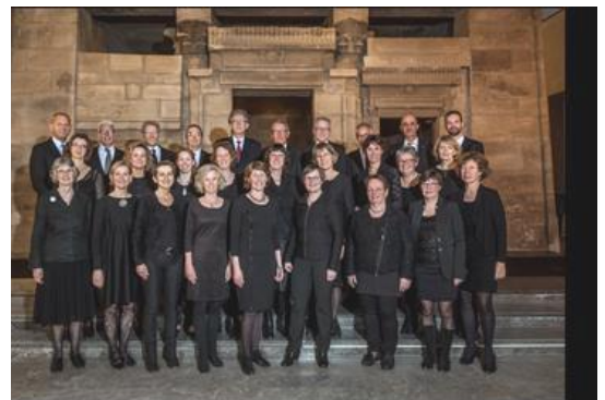
Cappella pro Cantibus zingt de Evensong op 3 juli

Onderweg zei iemand tegen Jezus: 'Ik wil met u meegaan. Het maakt niet uit waar u naartoe gaat !' Jezus zei tegen hem: 'Vossen hebben een hol en vogels hebben een nest. Maar de Mensenzoon heeft geen plek om uit te rusten.'