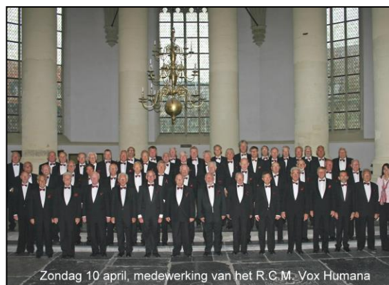
Zondag 10 april, medewerking van het R.C.M. Vox Humana

Gods Adem waait zijn woorden uit den hoge