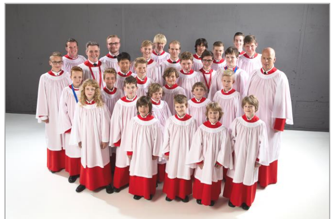
Het Roder Jongenskoor