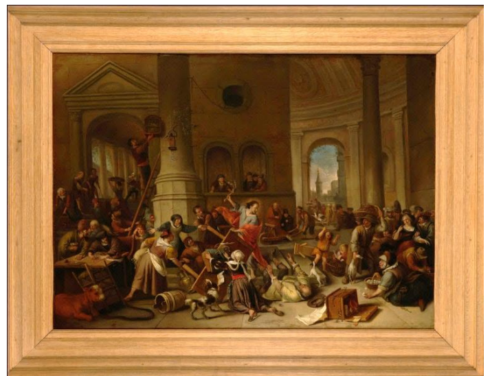
Jan Steen, 1675 Museum De Lakenhal

Minder bekend is dat op diezelfde dag Christus ook de wisselaars uit de tempel verdreef.