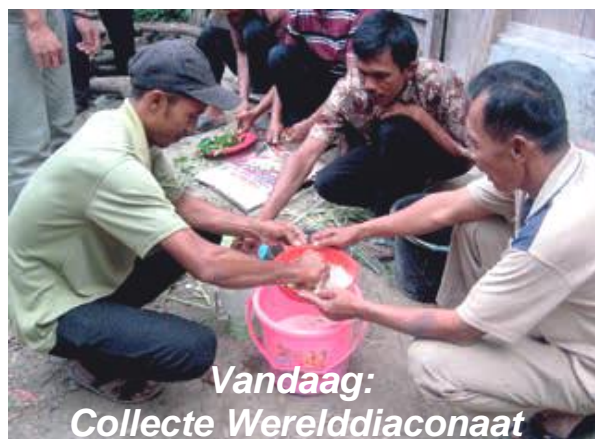
Vandaag: Collecte Werelddiaconaat