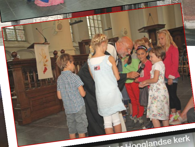
Boekpresentatie 700 jaar Hooglandse kerk