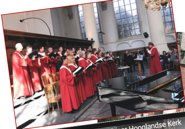
Impressie tentoonstelling 700 jaar Hooglandse Kerk