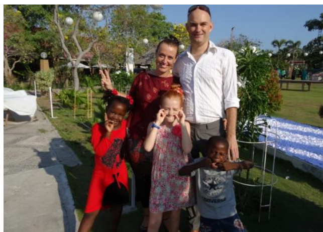
een groet uit Timor