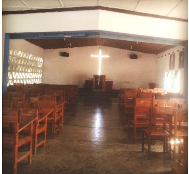
Heilige Geest, Ruach Adonai, God met ons

een fysiek kruis. Nee, een uitgespaard kruis. Het is er niet. En het is er toch: door het doorbrekende licht en de bries die er doorheen waait, wordt het zichtbaar en tastbaar.