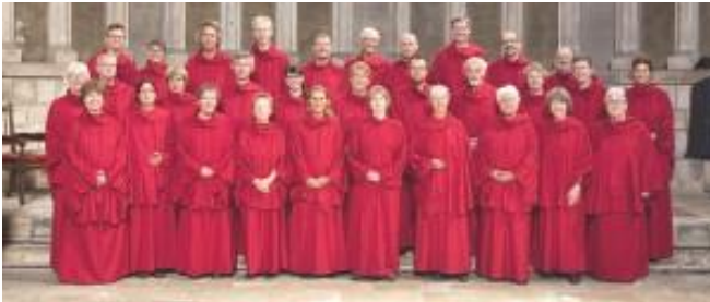
Schola Davidica uit Utrecht

De Schola Davidica zingt het 'Magnificat' en 'Nunc dimittis' van Thomas Tertius Noble. Het anthem is 'Lord thou hast been our refuge' (psalm 90) van Ralph Vaughan Williams en gezongen door beide koren.