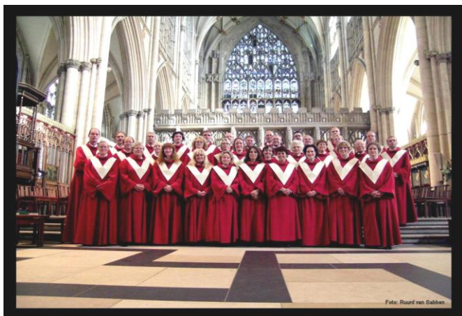
De Leidse Cantorij in York archieffoto