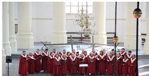
Leidse Cantorij, Pasen 2012