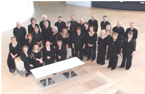
Cantemus Chamber Choir Wales