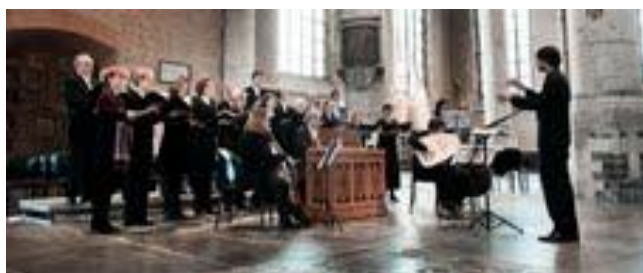
Het Leids Cantate Consort